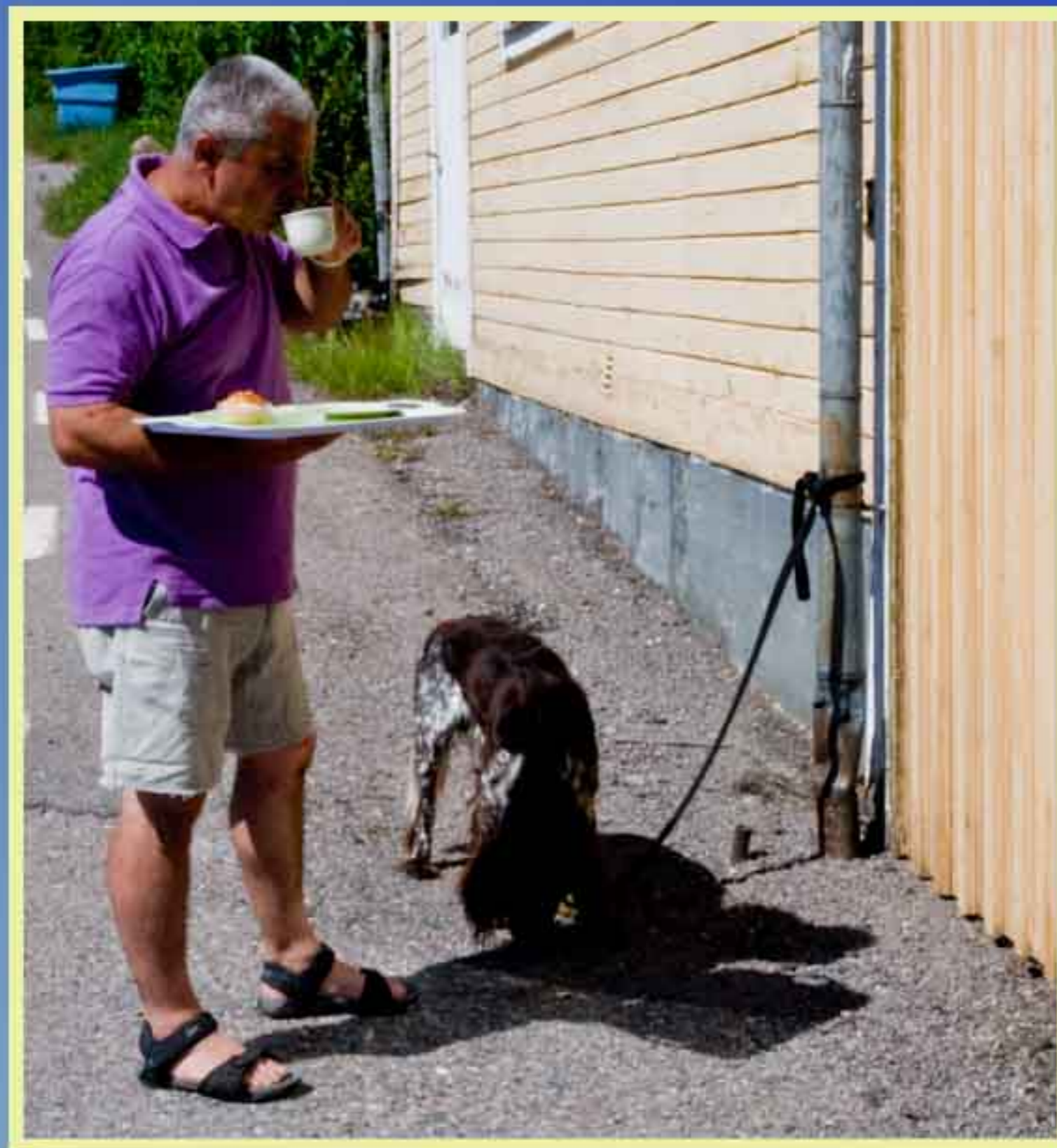
Charlie njuter av vattenkoppen utomhus medan husse dricker kaffe