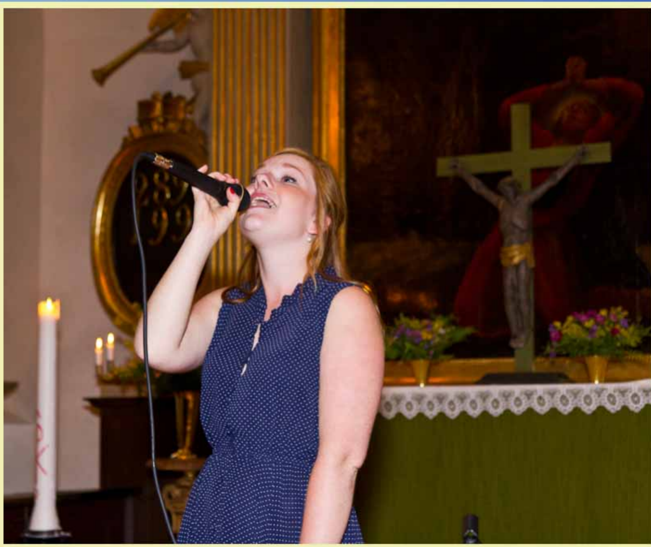
Avslutning av de unga Kvarsebomusikerna