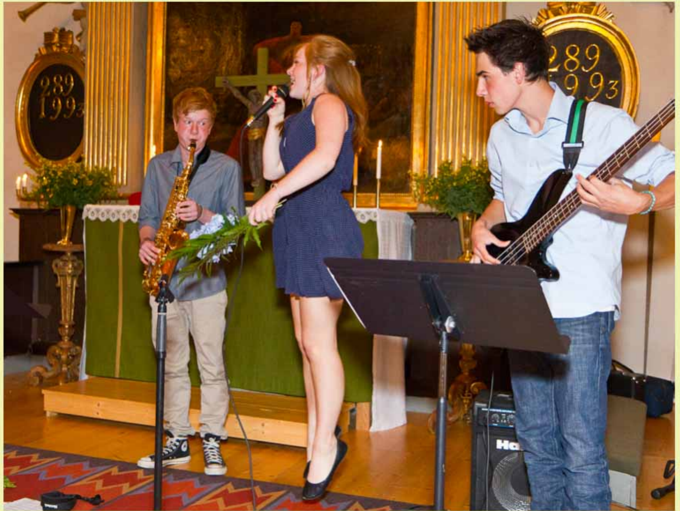
Här kommer det med inlevelse

Kvarsebo kyrka Musik i sommarkvällen 2011