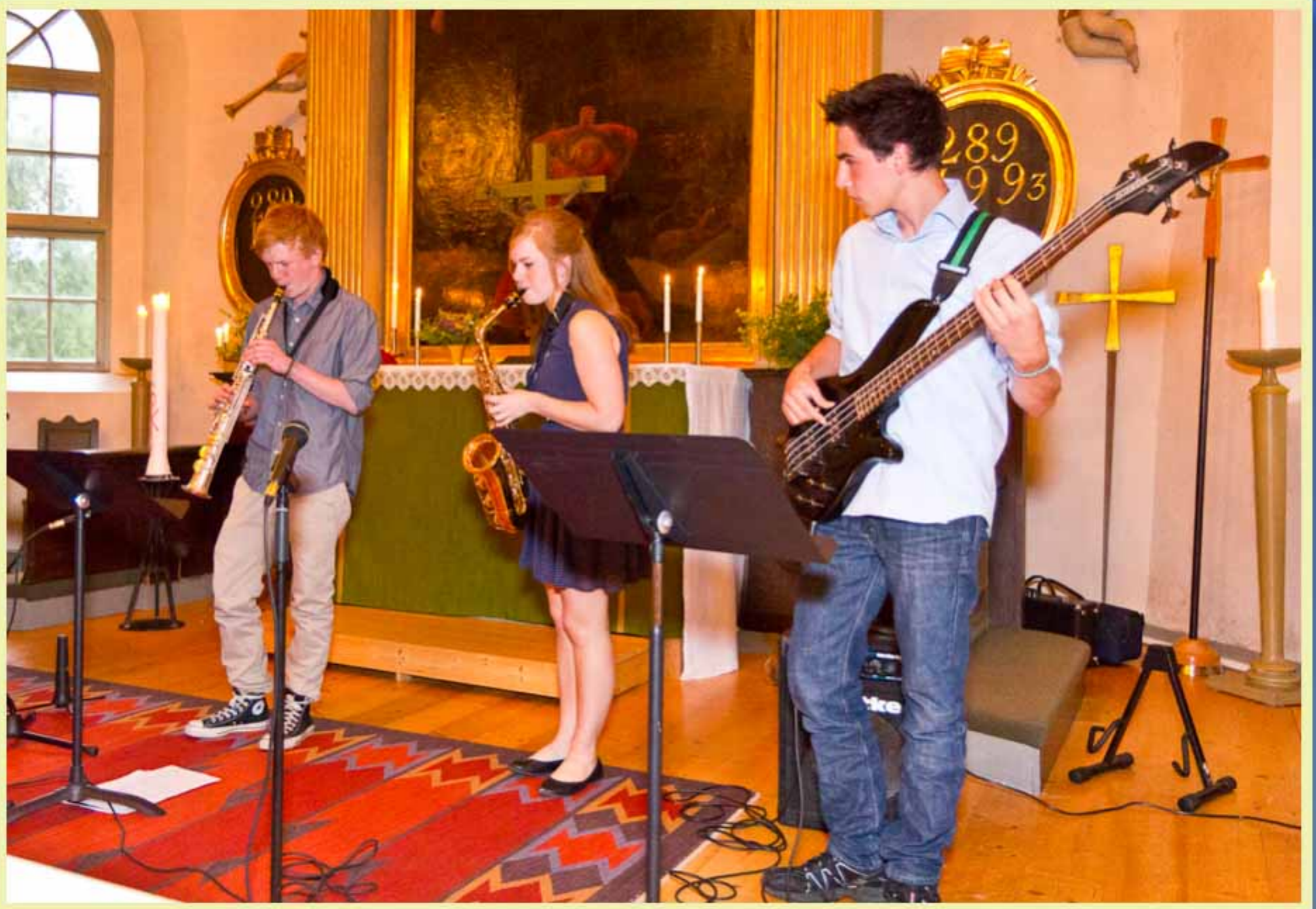
Avslutning av de unga Kvarsebomusikerna