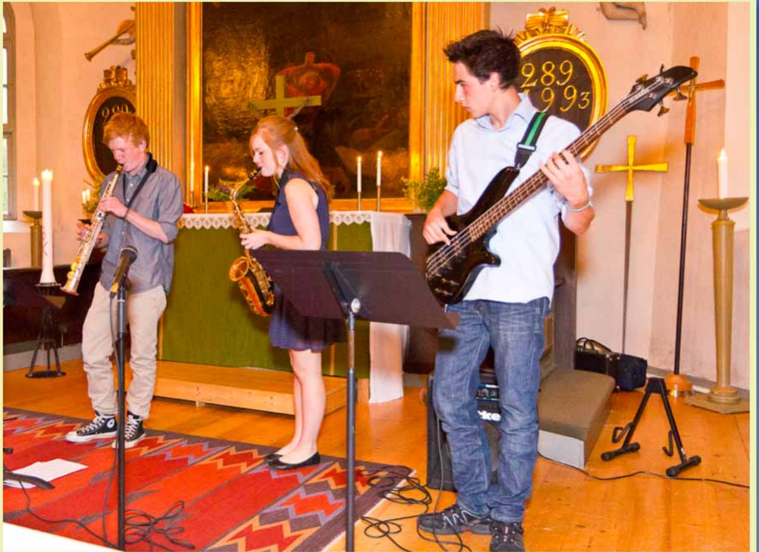
Avslutning av de unga Kvarsebomusikerna

Kvarsebo kyrka Musik i sommarkvällen 2011