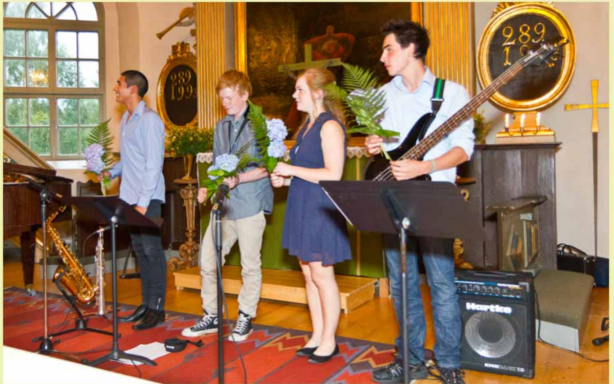
Men publiken applåderar fram ett extranummer