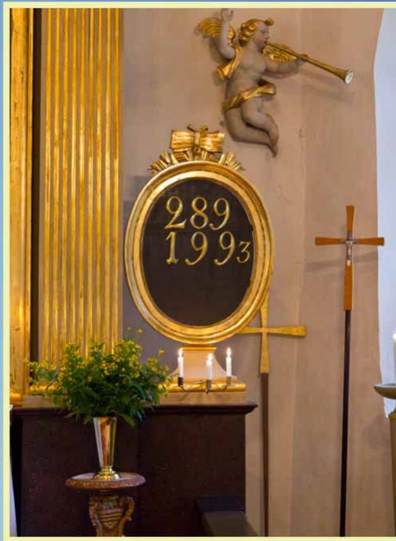
Kvällsandakt i Kvarsebo kyrka med musik i sommarkvällen