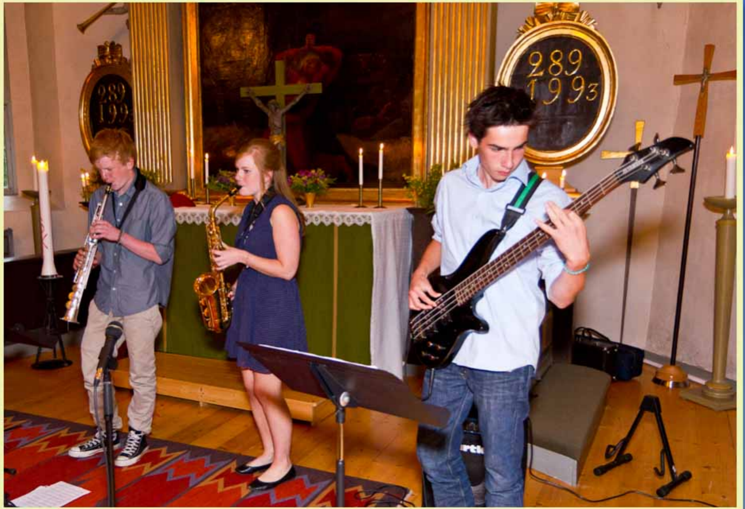
Avslutning av de unga Kvarsebomusikerna